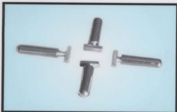
- "T" - VIJAK