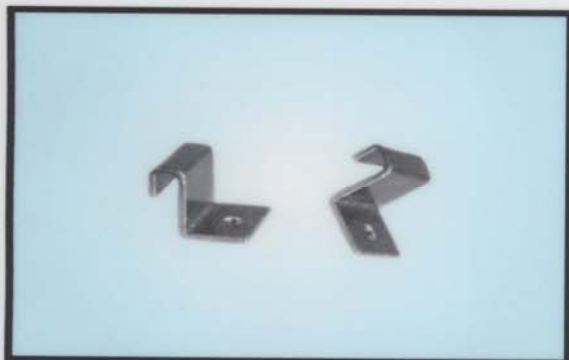
- "Z" - LIM