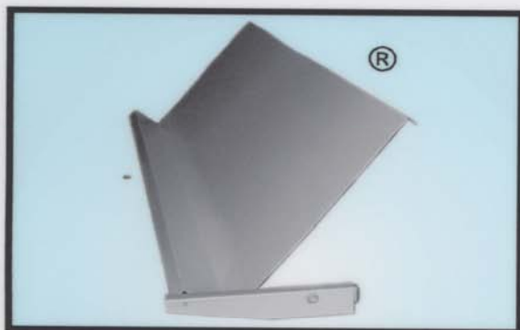
-POLICE ZA KNJIGE I PROSPEKTE (a)

Proizvodnja opreme za montažu sajamskih izložbenih štandova