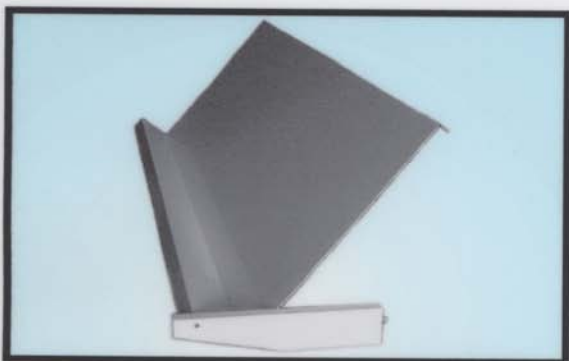
-POLICE ZA KNJIGE I PROSPEKTE (b)